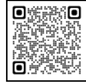
徳島寮ホームページQRコード

2 所在地 〒770-0006 徳島市北矢三町一丁目1番34号 電話・ファクシミリ 088-632-5733