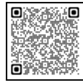
徳島駅前路線バス乗り場 案内図QRコード