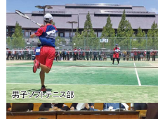
男子ソフトテニス部