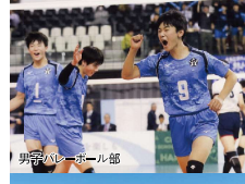
男子バレーボール部