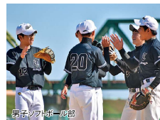
男子ソフトボール部