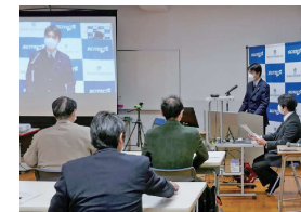
SSH オンライン発表会の様子

令和元年度から5年間、文部科学省からスーパーサイエンスハイスクールの指定(第II期)を受け、第I期での取組を深化させるとともに、創造力・独創性を高め、人や地球にやさしいものづくり教育に取り組んでいます。主体的・協働的に行動でき、これからの日本の「ものづくり」を担う技術・技能者、特に工業・水産関係の科学技術者として、国際社会で活躍することができる「人財」の育成を進めています。